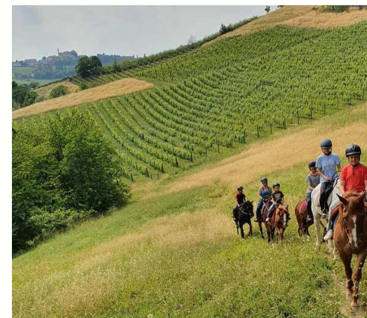
offerta differenziata e servizi